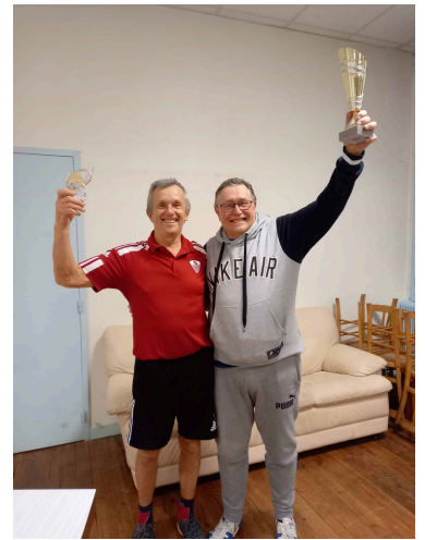
TABLEAU DES MOINS CLASSÉS