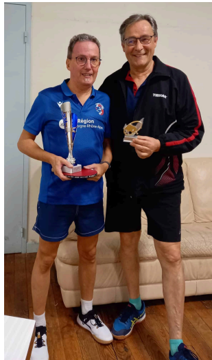
TABLEAU + 55 ANS