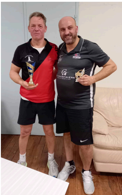
TABLEAU DES PLUS CLASSÉS