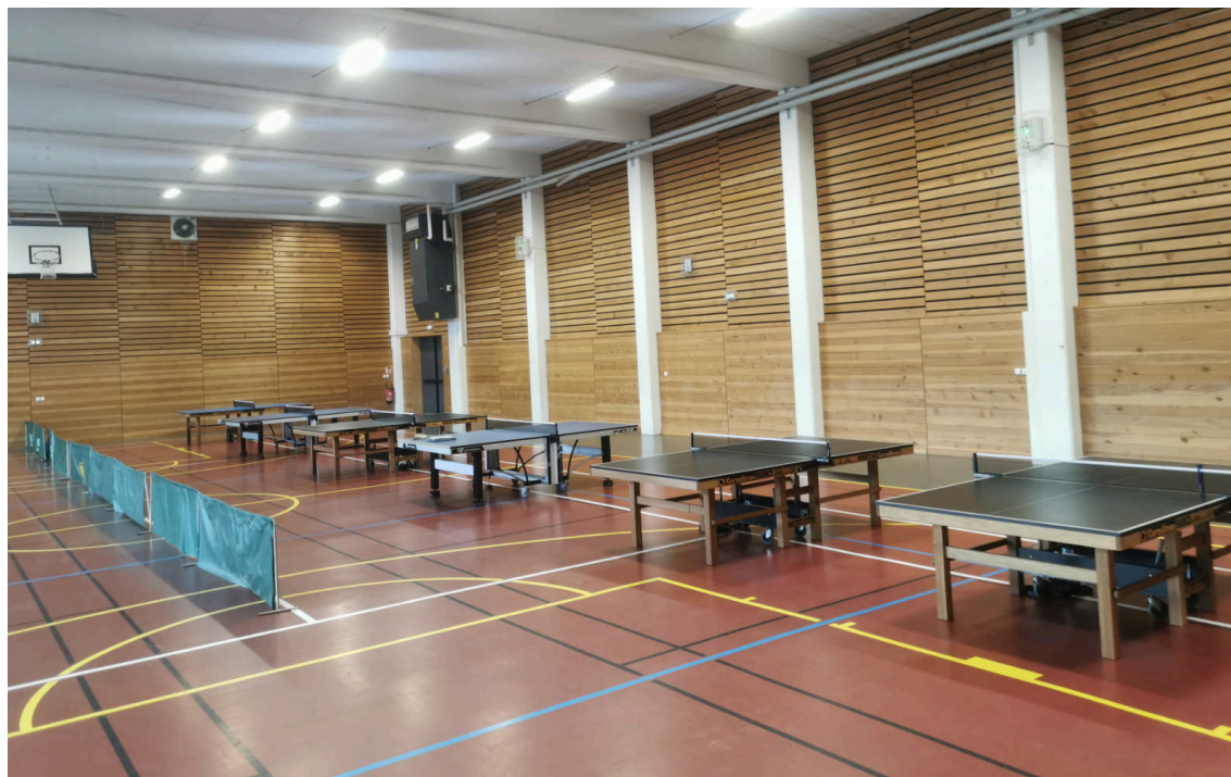
Création d'un nouveau club "Haut Pilat" à Saint-Genest-Malifaux

👉 Tous ces dispositifs, modalités et contacts sont détaillés sur notre site.