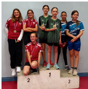
TABLEAU A :